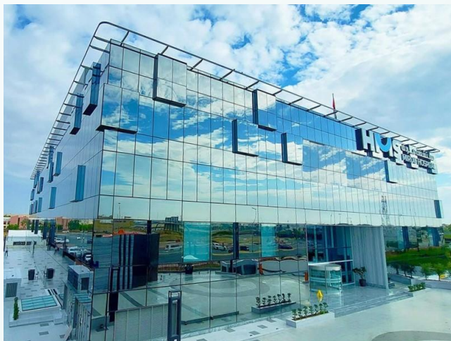
(HMS Group: Best Hospital in Dubai (2023), URL: https://www.hmsmirdifhospital.ae/en/gallery , Stand: 08.11.2023)

Das HMS Mirdif Hospital in Dubai nahm im Dezember 2021 seinen Betrieb auf. Seitdem werden dort multidisziplinäre Gesundheitsdienstleistungen und internationale Patientenbetreuung mit mehr als 160 Betten angeboten. Als Besonderheit stehen für die Patientenunterbringung zum Beispiel eine Reihe von luxuriösen Suiten zur Verfügung, die den Patienten höchsten Standard in Bezug auf Luxus und Privatsphäre garantieren. Im HMS Mirdif Hospital wird besonderer Wert auf fortschrittliche medizinische Technologie und die Beschäftigung hochqualifizierter und erfahrener Gesundheitsfachleute gelegt. (HMS Group: Best Hospital in Dubai (2023), URL: https://www.hmsmirdifhospital.ae/ , Stand: 08.11.2023)